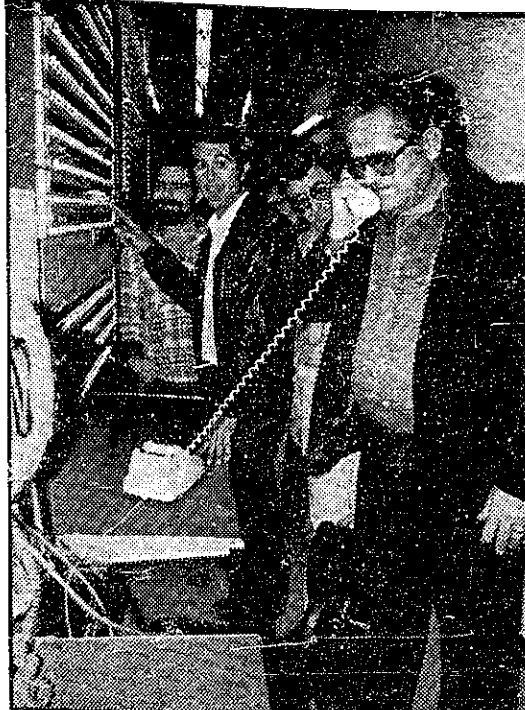
שר התיקושרת מרדכי ציפורי, הנך בסוף השבוע שעבר מרכזית טלפונים חדשה באזור הכינרת. שותופי לישושים בסביבה 6000 קוויים חדשים.